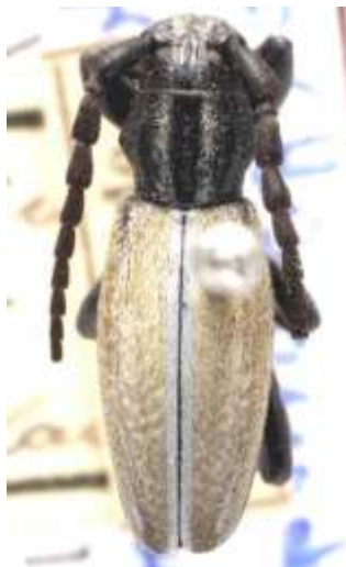
Fig. 16: I. (H.) perezii hispanicum . Catalogado sintipo de “ D. hispanicum v. griseopubescens ”. MNCNM.