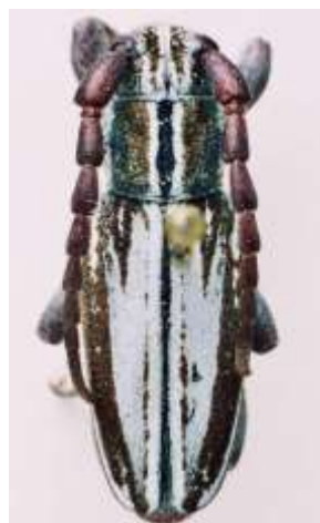
Fig. 3: I. (H.) abulense . Etiquetado " D. umbripenne hispanoloide ". MNCNM.