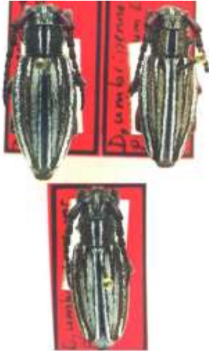
Fig. 4: I. (H.) abulense . Catalogados sintipos de " D. umbripenne var. plurilineatum ". MNCNM

Saz. La localidad de Fuente el Saz pertenece a la provincia de Madrid, donde no se captura granulipenne ). SALAMANCA: B. del Cerro, Salamanca.