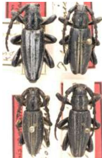
Fig. 17: I. (H.) perezii hispanicum . Catalogados sintipos de “ D. hispanicum v. cebollense ”. MNCNM.