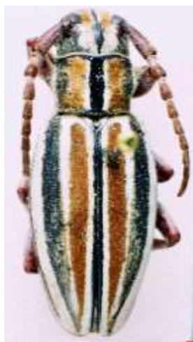
Fig. 19: I. (H.) zarcoi turdetanum . Etiquetado “ D. ignotum denudatum ”. MNCNM.

Andalucía: ALMERÍA: Puerto de la Ragua – Bayárcal.