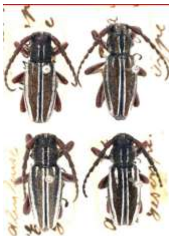
Fig. 2: Catalogados lectotipos de I.(H.) abulense . MNCNM.

Castilla y León: ÁVILA: Arroyo de la Cereceda, Ávila (101 ♂♂ y 69 ♀♀), El Arenal, La Lastra (127 ♂♂ y 81 ♀♀), Las Parameras, Las Rozas-Gredos, Parameras de Ávila, Piedrahita-Cerro Alto, Puerto de Chía, Puerto del Arenal (219 ♂♂ y 54 ♀♀), Puerto del Pico (176 ♂♂ y 41 ♀♀), Puerto de Menga (433 ♂♂ y 214 ♀♀), Puerto de Paramera, Puerto de Villatoro, Sierra de Gredos, Valle del Tormes, Villatoro.