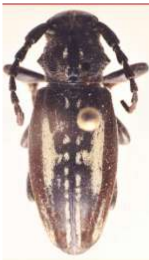
Fig. 14: I. (H.) perezii perezii variedad. MNCNM.

ghilianii e hispanicum queda reflejada en la denominada “caja histórica” de Escalera (Fig. 15), en la que este autor remarca la variabilidad geográfica de ambos taxones.