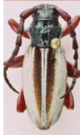
Fig. 11: I. (H.) neilense . Catalogado paralectotipo de " D. almarzense ". MNCNM.