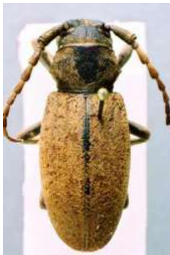
Fig. 1: I. (B.) nigrosparsum . Etiquetado “ D. parmeniforme ”. MNCNM.