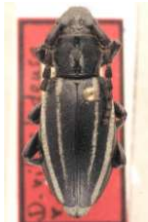
Fig. 13: I. (H.) neilense . Catalogado sintipo de " D. villosladense var. circumalbum ". MNCNM.