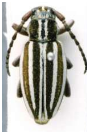
Fig. 9: I. (H.) molitor . Catalogado sintipo de " D. molitor v. superbum ". MNCNM.