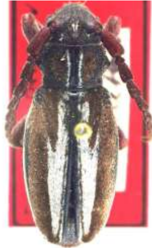
Fig. 5: I. (H.) abulense . Catalogado sintipo de " D. umbripenne var. perezoides ". MNCNM.