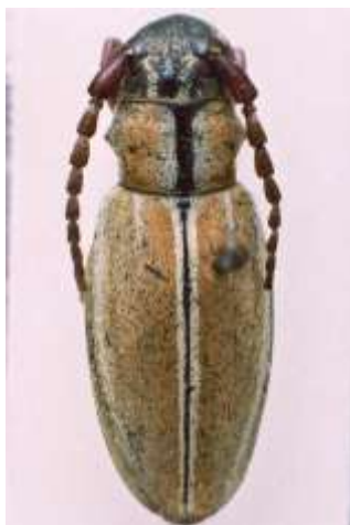
Fig. 8: I. (H.) circumcinctum . Etiquetado " D. burgosense ". MNCNM.

Saz, A. del, Zapata, J.L. & Simón, A. Datos corológicos de los ejemplares del género Iberodorcadion Breuning, 1943 (Coleoptera, Cerambycidae) de la colección del Museo Nacional de Ciencias Naturales de Madrid, España.