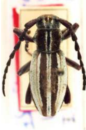
Fig. 10: Catalogado paralectotipo de I. (H.) neilense . MNCNM.

Saz, A. del, Zapata, J.L. & Simón, A. Datos corológicos de los ejemplares del género Iberodorcadion Breuning, 1943 (Coleoptera, Cerambycidae) de la colección del Museo Nacional de Ciencias Naturales de Madrid, España.