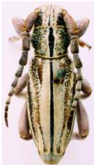
Fig. 6: I. (H.) abulense granulipenne . MNCNM.