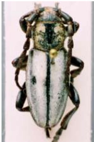
Fig. 12: I. (H.) neilense . Catalogado sintipo de " D. villosladense var. nivosum ". MNCNM.